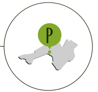
PROSECCO DOCG ZONE